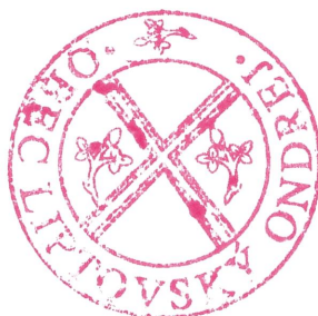
p. Žubor L.

Na tomto VZN obce Liptovský Ondrej sa uznieslo obecné zastupiteľstvo obce Liptovský Ondrej dňa ..... svojím uznesením č. .... a toto VZN nadobúda účinnosť 1. januára 2025.